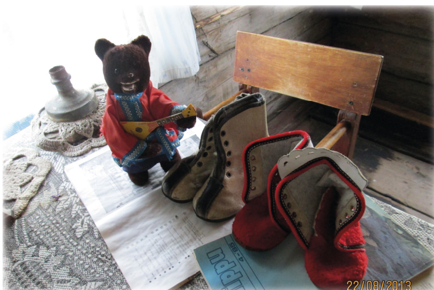
Детские вещи из экспозиции этнографического музея Хайколя)