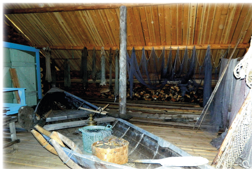
Этнографический музей Хайколя