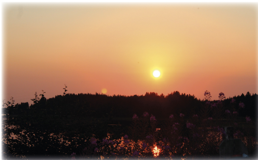
Ласковый хайкольский закат