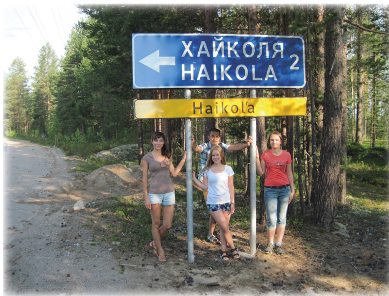
Студенты ПетрГУ — участники второй волонтерской школы

Хайколя. Небольшая деревушка в Калевальском районе вдали от благ цивилизации. И поистине одно из сокровищ Беломорской Карелии.