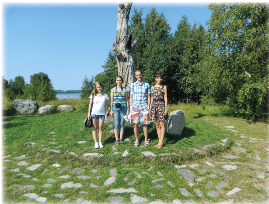
Сосна Лённрота — самое известное место Калевалы

Это очень важно для нас, поскольку в них воевали будущие известные карельские писатели. Третья школа собрала еще больше молодых исследователей, с определенным запасом опыта обращения с музейными предметами, и их работа была более самостоятельной. Вознаграждением для них стало участие в международном фестивале традиционной народной музыки «Соммело».