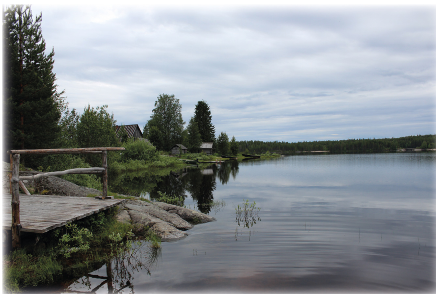
Вид на деревню Хайколя со стороны озера