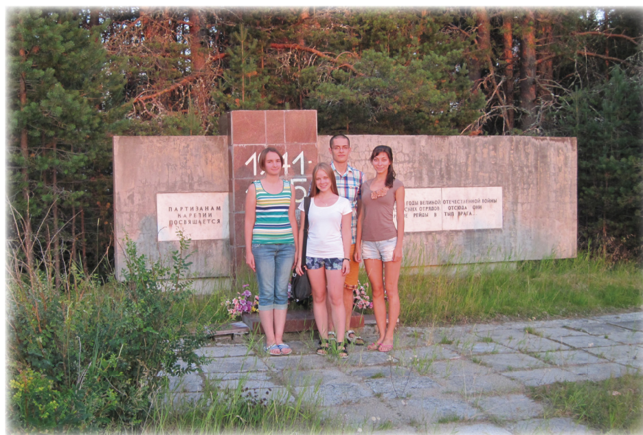
У памятника партизанам Карелии

Во время второй школы дополнительно была организована экскурсия на материковую часть деревни Хайколя, где стоит памятник партизанам пяти партизанских отрядов.