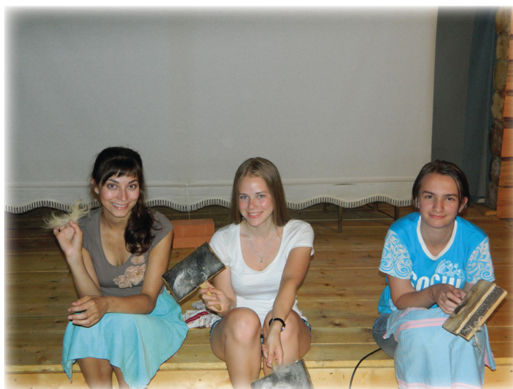
Девушки учатся прясть шерсть