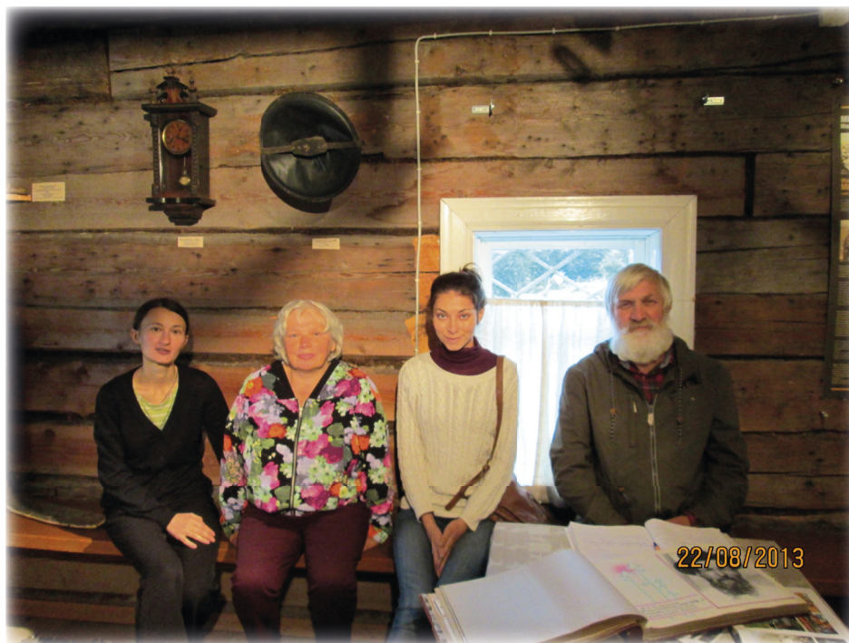
В Музее рунопевцев Калевалы