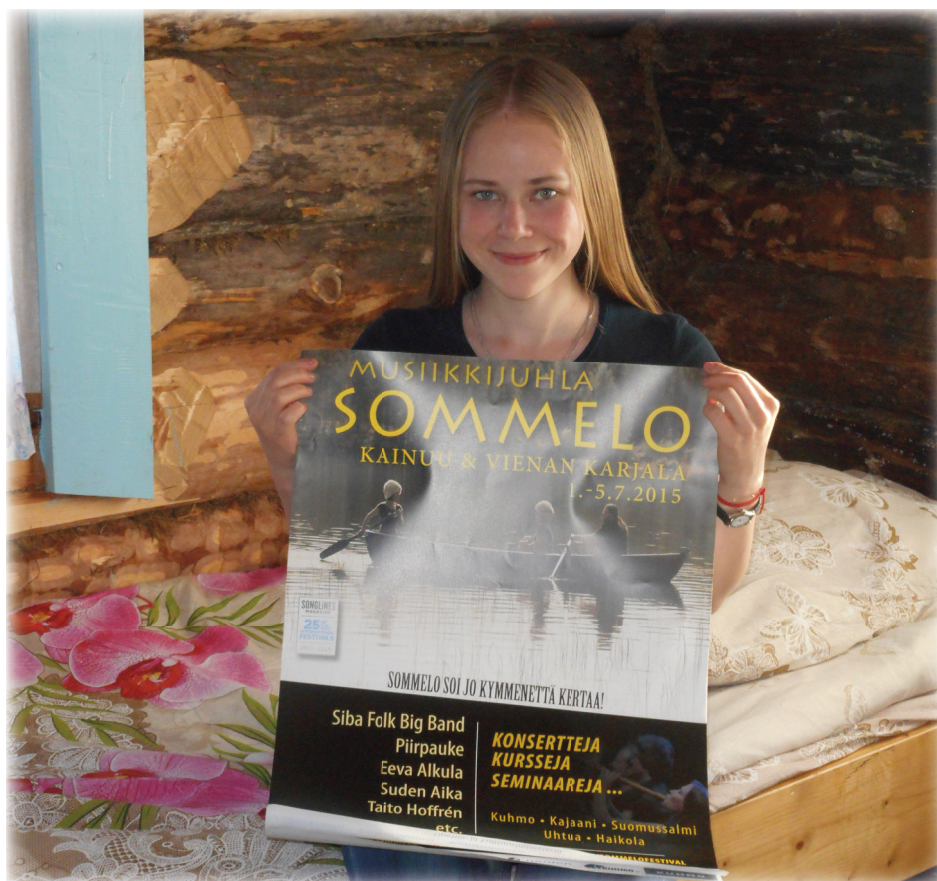
Готовимся помогать в проведении «Соммело» на территории Хайколя

Это очень важно для нас, поскольку в них воевали будущие известные карельские писатели. Третья школа собрала еще больше молодых исследователей, с определенным запасом опыта обращения с музейными предметами, и их работа была более самостоятельной. Вознаграждением для них стало участие в международном фестивале традиционной народной музыки «Соммело».