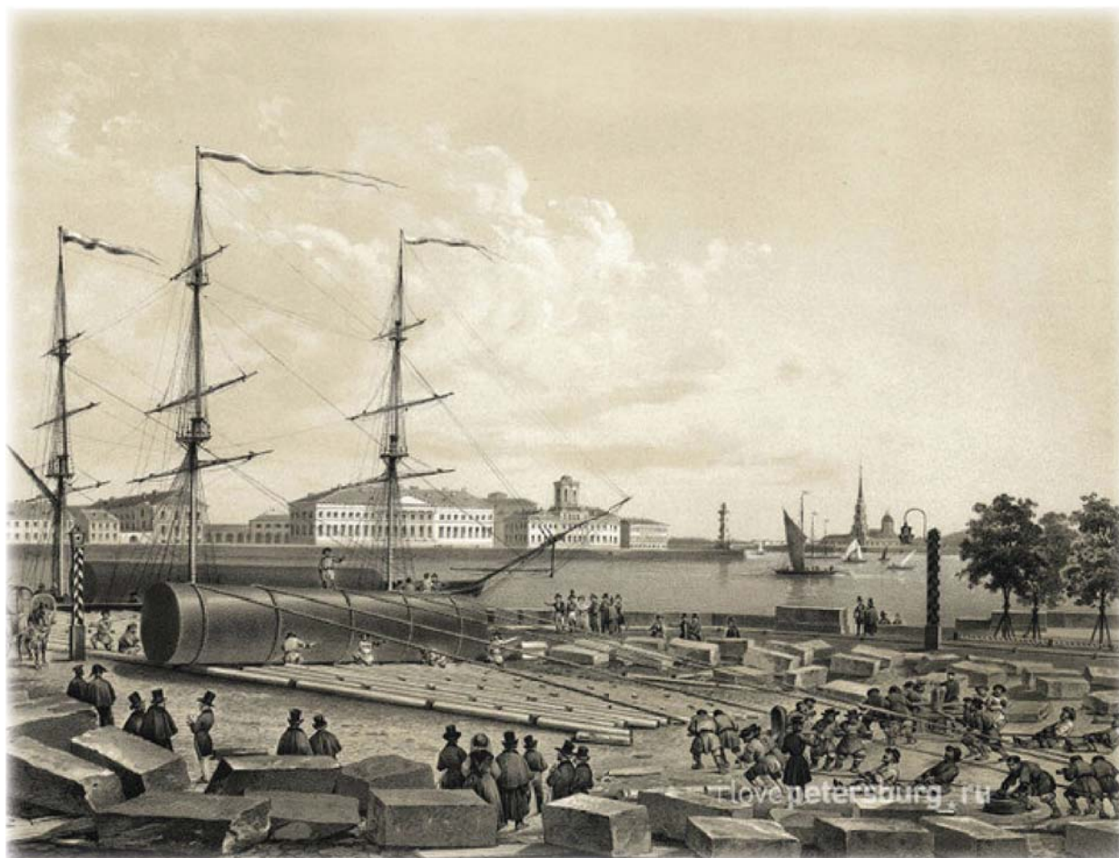
Выгрузка и перекачка колон. Литография с рисунка О. Монферрана. [73: 180]