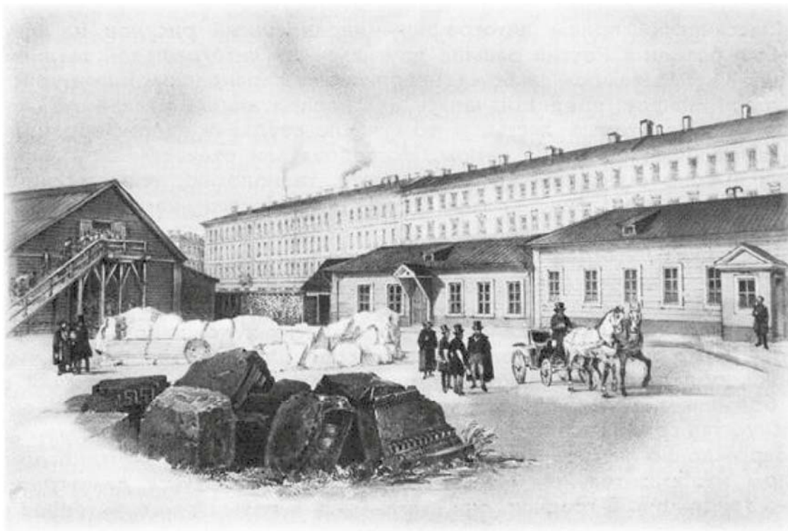
Барак для рабочих и хозяйственные постройки. Литография Бенуа по рисунку О.Монферрана. 1845г. [73: 180]

рые применялись в то время на строительстве Петербурга. Основным материалом для конструкций (фундамент, стилобат, колонны) был гранит рапакиви из карьеров Пютерлакса, для облицовки фасадов храма, резных порталов наружных дверей — рускеальский мрамор. Тивдийский мрамор розового цвета использован в отделке цокольной части стен и пилонов, центрального нефа, многочисленных пилястр коринфского ордера и астрагала фриза. Плитами рускеальского мрамора серых оттенков и тивдийского розового мрамора в виде косой шахматной клетки был выложен пол. А центральную, подкупольную, часть пола украшает розетка из тивдийского мрамора. Прочный шокшинский порфир темно-красного цвета украсил стены и пилоны храма, фриз большого антаблемента, царских врат, главного иконостаса (солеи, ступеней, деталей цоколя). Соломенская брекчия использована в оформлении иконостаса придела св. Екатерины, а также цокольной части стен и пилонов (из этого камня выполнены прямоугольные филенки и круглые медальоны). Серый аспидный сланец пошел на нижнюю часть широкого плинта цоколя стен храма [73: 60—64; 57: 23—24]. Добыча и обработка соломенской брекчии из-за ее большой хрупкости была особенно трудной. По мнению А. Г. Булаха и А. Г. Аббакумовой, украшение Исаакиевского собора «тщательно отполированными блестящими вставками из соломенской брекчии» является «плодом огромного мастерства и великого терпения русских камнетесов», среди которых, несомненно, были и олончане [59: 61].