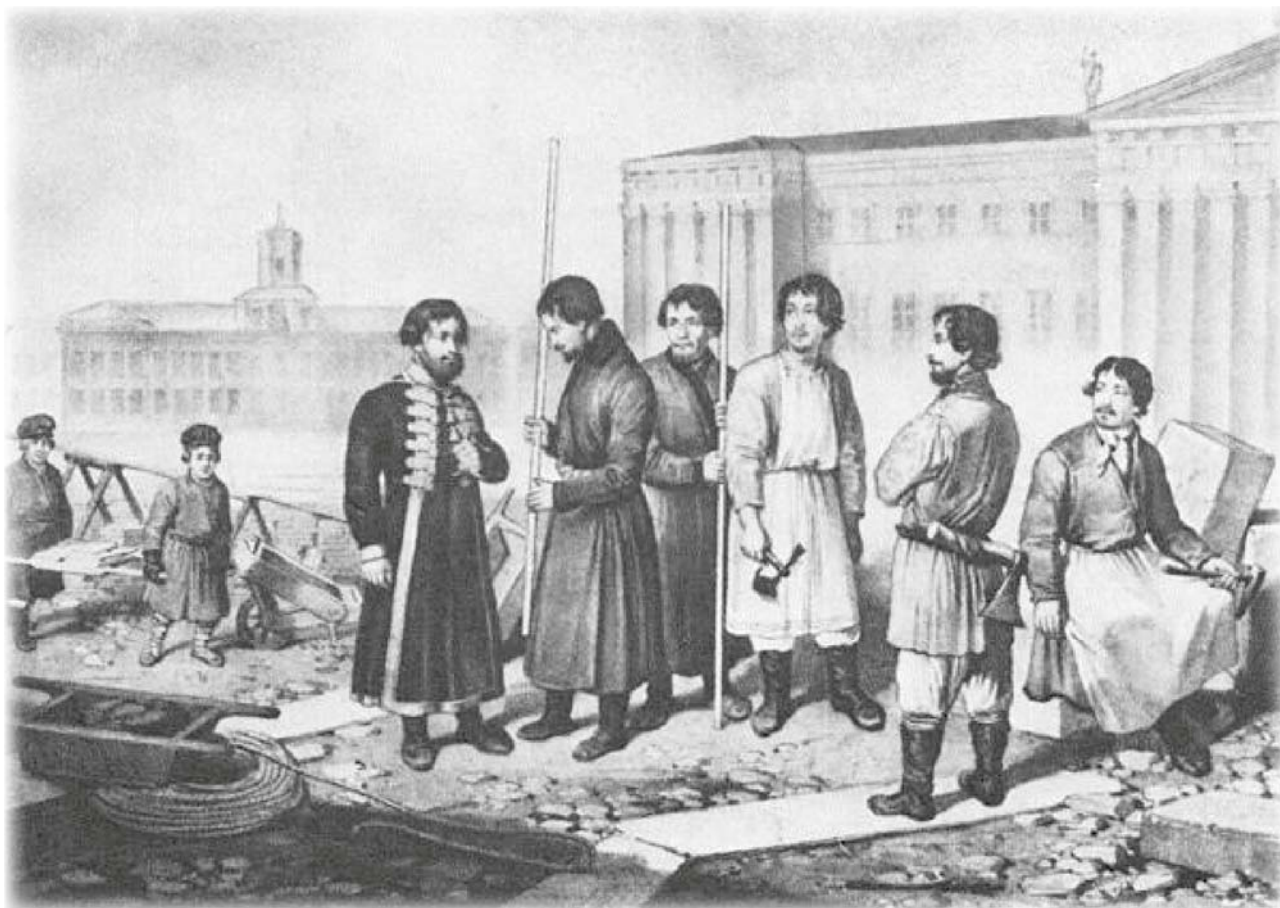
Групповой портрет рабочих-строителей. Литография Байо по рисунку О. Монферрана. 1836г. [73: 138]

ценки на производимые работы по добыче, обработке и доставке камня, места найма, условия жизни и труда рабочих.