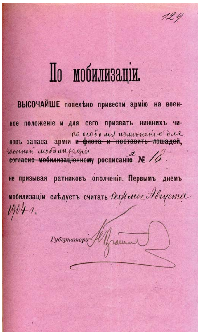
Распоряжение олонечкого губернатора Олонечкому губернскому правлению о начале мобилизации нижних чинов запаса. Август 1904 г.