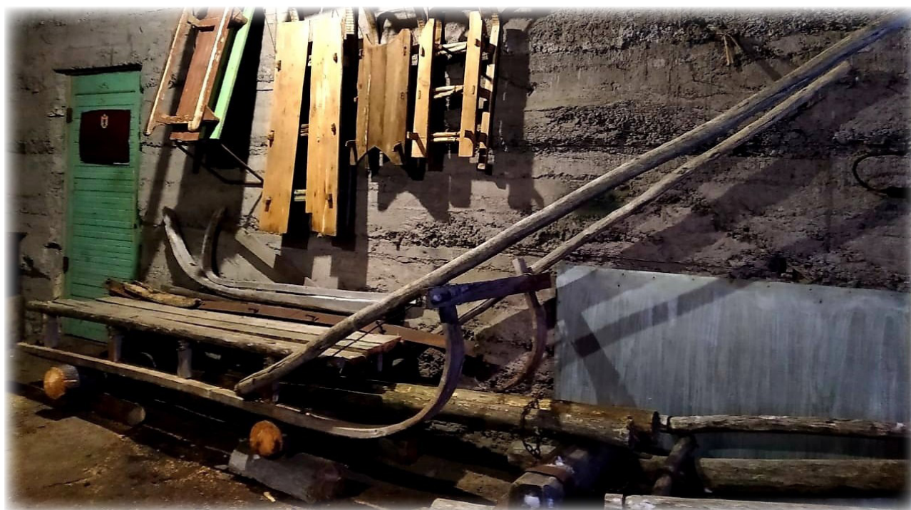
Сани-волокуши. Музей «Дом лесника» в пос. Авнепорог. Фото Е. Д. Васильева, 2024 г