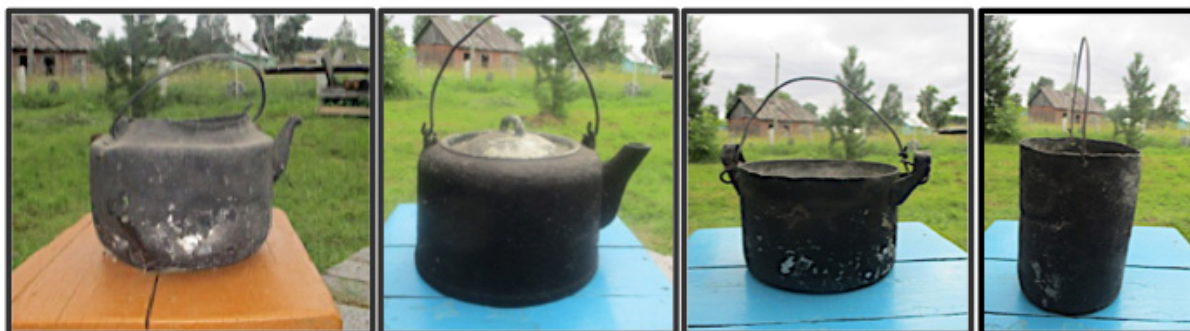
Чайники и котелки, середина XX века, музей «Дом лесника», пос. Авнепорог. 2024 г.

Условия жизни рабочих в Авнепороге в 1933 г. оставались, как и повсеместно, крайне тяжёлыми, что констатировалось в газете без прикрас. Хотя справиться с ремонтом и закончить строительство барakov должны были помочь 40 рабочих, однако лесорубам и возчикам вменялось в обязанность своими силами в свободное время разделявать лес для строительства помещений; провести дезинфекцию старых барakov, в которых кишели «тараканы и клопы в несметном количестве»; побелить бараки и конюшни; заготовить сено для лошадей, число которых планировалось увеличить с 27 до 114 [15]. Сообщалось также, что не хватало кожаной обуви, баков для кипячения воды и чайников, не были отремонтированы своевременно панко-реги — сани-волокуши для вывозки леса с делянок [15].