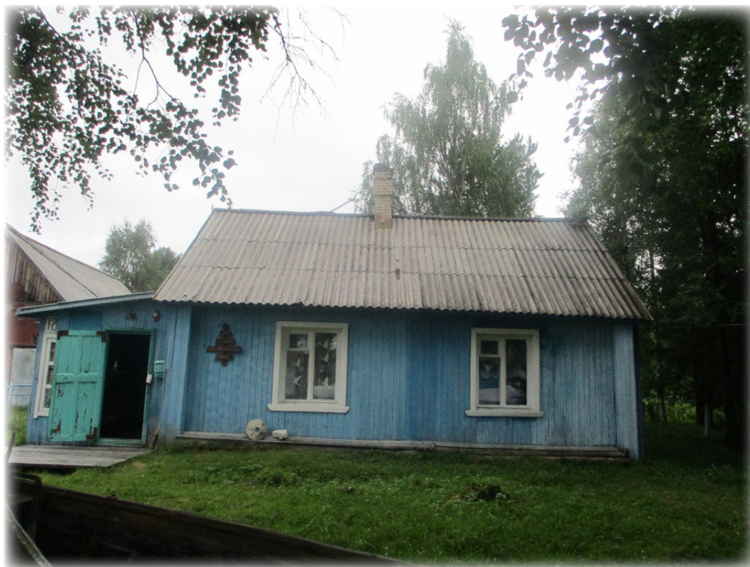
Музей «Дом лесника» в пос. Авнепорог.