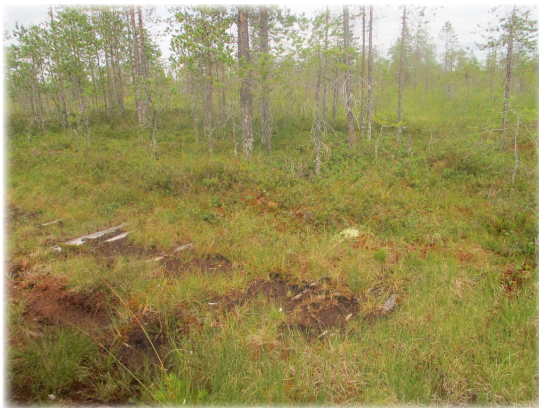
Следы конно-лежевой дороги, действовавшей в середине XX века во время лесозаготовок.