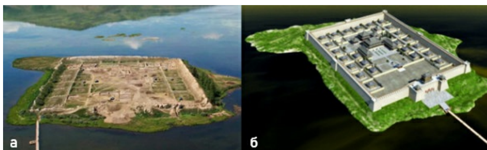
Рис. 3. Крепость Пор-Бажын: а – фотография современного вида. Автор Андрей Панин 1 ; б – 3D реконструкция. Автор Арно Шуберт 2

На восточной стороне сохранились ворота с превратными башнями, на башни ведут остатки въездных пандусов (рис. 3).