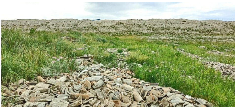
Рис. 2. Развалины крепости Пор-Бажын и остатки черепицы.

В отличие от других уйгурских сооружений, Пор-Бажын единственное городище, где имеется дворцовый комплекс. На территории остальных крепостей были выявлены лишь остатки каркасных зданий, крытых тяжелыми черепичными крышами, а также длинные помещения казарменного типа и землянки. Развалины крепости Пор-Бажын занимают практически всю площадь острова и представляют собой правильный прямоугольник, ориентированный по сторонам света, с размерами 211 на 158 метров [Тулуш, 2019: 28]. Высота крепостных стен, даже в полуразрушенном виде, достигает до 10 метров (рис. 2).